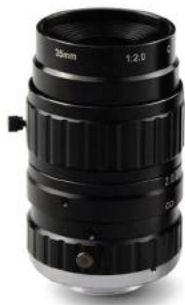
手動光圈鏡頭 C 接口 1"